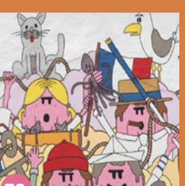
Visuel de couverture Los Pepes 41

Visites guidées du MaCO avec l'Office de Tourisme Guided tours of the MaCO with the Tourist Office Tel : 04 86 84 04 04 Plus d'information / More informations : k-live.fr